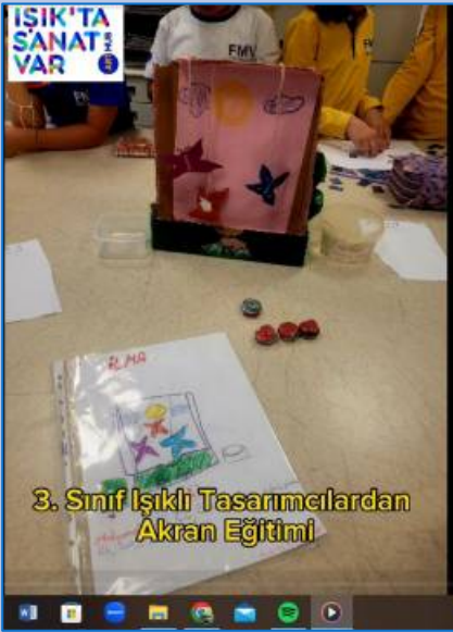
3. Sınıf Işıklı Tasarımcılardan Akran Eğitimi

On World Art Day, our 5th grade students exhibited their works based on art movements and works of world artists in the foyer of our school.