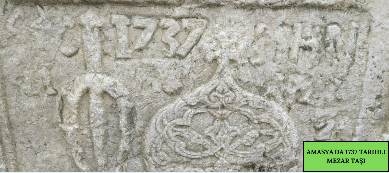
AMASYA'DA 1737 TARİHLİ MEZAR TAŞI