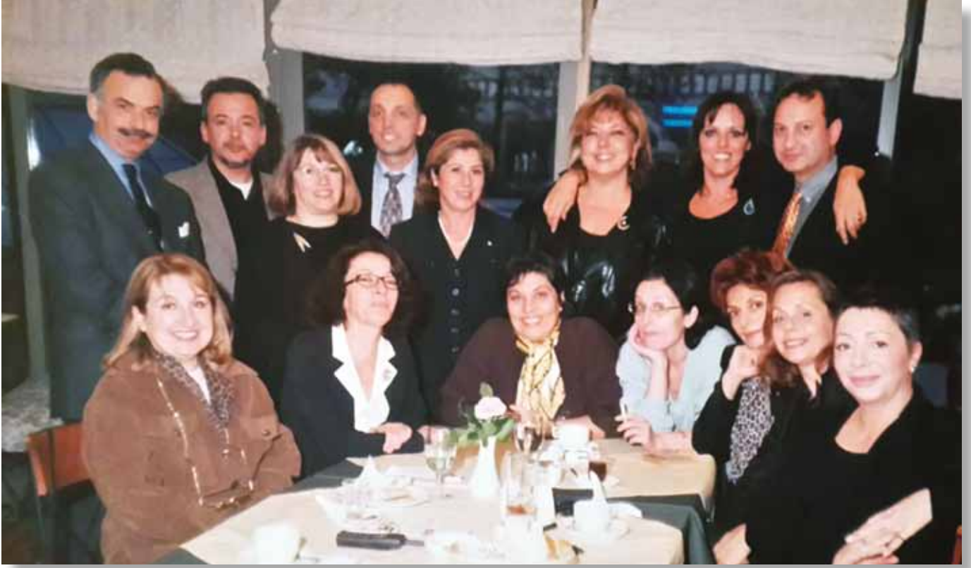
1969 Mezunları Işık Ev'de Bir 14 Aralık Buluşmasında

rındaki o gençler haline geliveriyoruz. Sanki dünmüş gibi... Seneler siliniyor.